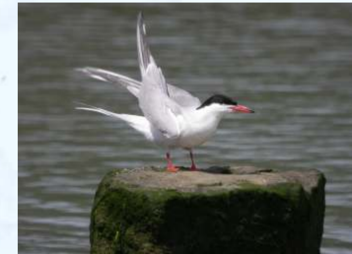
Navadna igra.

Navadna igra je ena najboljših, vsekakor pa najbolj elegantnih letalk. Razpršeno gnezdi po Evropi, v Sloveniji pa le ponekod v severovzhodnem delu in v Se oveljskih solinah. Iz prezimovališ ob obalah Afrike se vrne aprila. V solinah gnezdi nekaj deset parov. Poletni nalivi pogosto odplaknejo igrina jajca z nasipov in oto kov v vodo. Zato smo v nekaj solnih poljih na Fontaniggeah v okviru projekta LIFE postavili posebne gnezdilne splave.