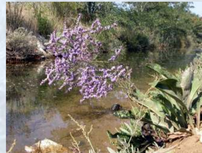
Ozkolistna mrežica.

Ozkolistna mrežica je trajnica z mo no koreniko, s trajnozelenimi, trdimi in usnjatimi listi ter drobnimi vijoli astimi cvetovi. Je slanuša s solnimi zlezami na površini listov, skozi katere izlo a sol, ki je ob suhem vremenu vidna v obliki kock. Neko so jo nabirali zaradi suhega cvetja in jo s tem tudi precej ogrozili. V okviru LIFE akcij osveš anja, obiskovalcem parka sporo amo, da rastlin v parku ne trgamo, ker so najlepše v naravi.